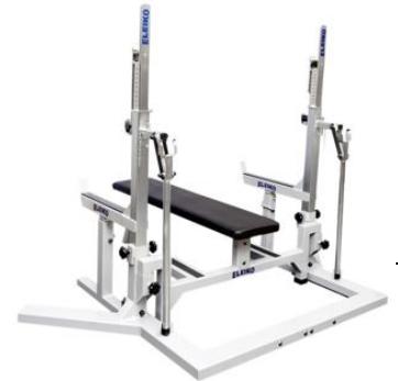
Panca Paralimpica (ParaPowerlifting)