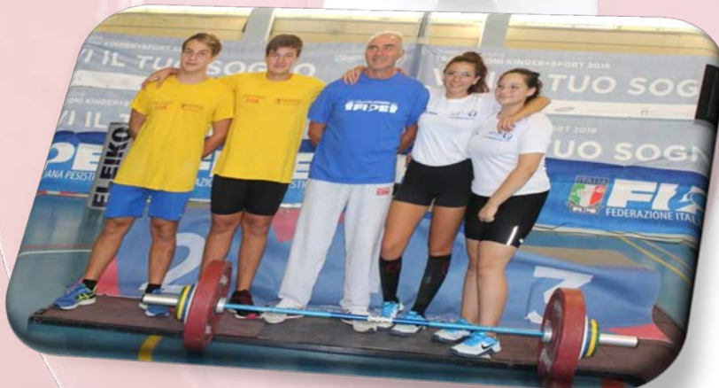
Tittoto | Longhin | Chiarotto | Aquilino | Ommeniello Squadra presente al Trofeo CONI Kinder + sport